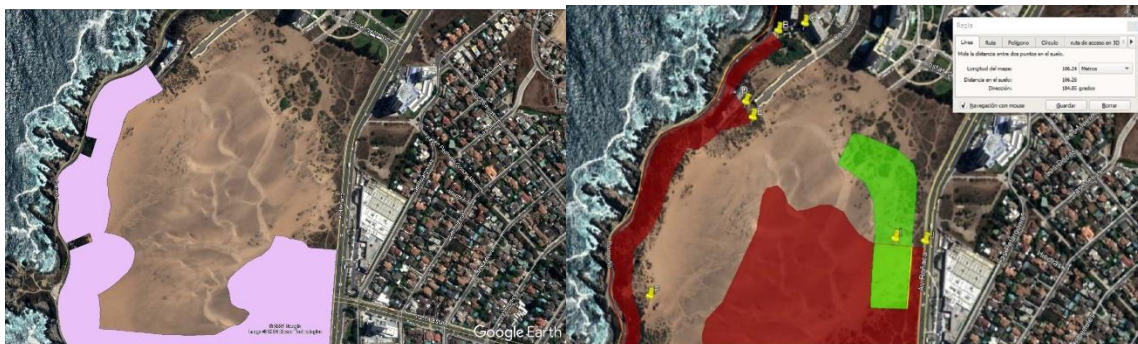
Figura 3: Comparación de límites de Santuario de la Naturaleza establecidos por D.S. N°45 de 26 de diciembre de 2012 del MMA y límites establecidos por los recurrentes en su escrito de ampliación a la acción de protección de autos.

En la imagen del costado izquierdo se puede ver el polígono del área del Santuario de la Naturaleza Campo Dunar de la Punta de Concón, extraído de la ficha del Registro Nacional de Áreas Protegidas del Ministerio de Medio Ambiente ( http://bdrnap.mma.gob.cl/buscador-rnap/#/busqueda?p=10 ). La imagen del costado derecho corresponde al área dibujada por el recurrente en su escrito de ampliación. En ellas, es claro que en el sector en que se emplaza el proyecto los límites del polígono oficial son distintos de los que presenta el recurrente en su polígono.